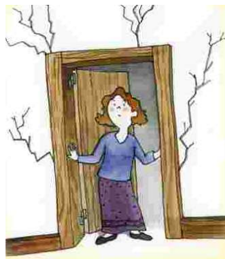
in E25_Auto_Proteção_Sismos.pdf, Câmara Municipal de Lisboa - Departamento de Proteção Civil